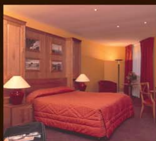
meuble lit, un vrai lit avec chevets sans effet placard