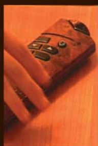
mécanisme unique, sans fixation murale garanti et breveté