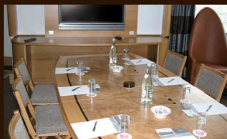
table modulable, connectique intégrée de 1 à 14 personnes