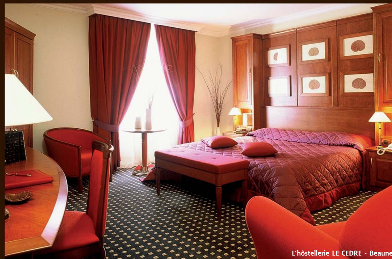
L'hôtellerie LE CEDRE - Beaune