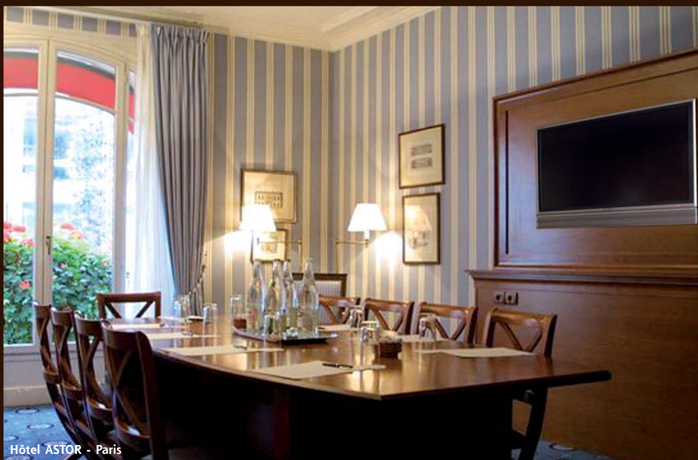
Hôtel ASTOR - Paris

...avec les dernières technologies dans un environnement luxueux et feutré