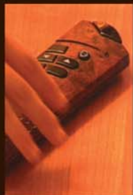
mécanisme unique, sans fixation murale garanti et breveté