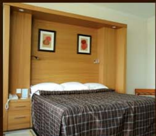
meuble lit, un vrai lit avec chevets sans effet placard