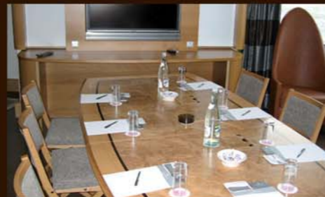
table modulable, connectique intégrée de 1 à 14 personnes